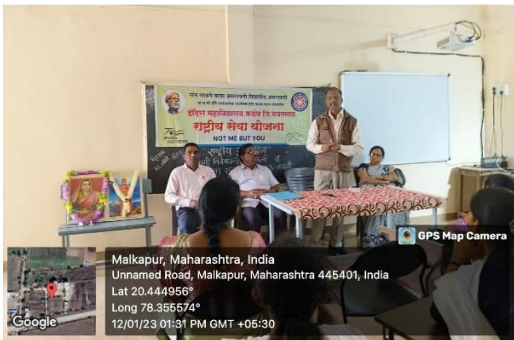
Expert Delivering Lecture on Women and Youth Empowerment